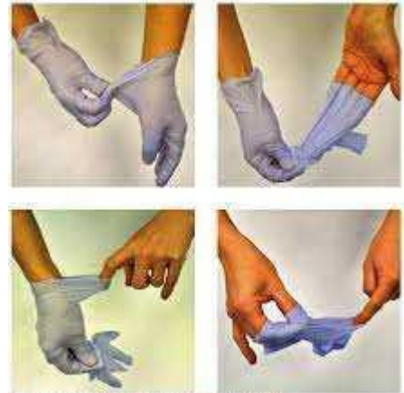
Figura 12.5. Tecnica di rimozione dei guanti.